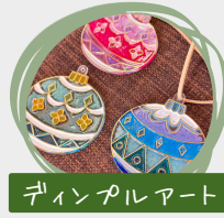
ディンプルアート