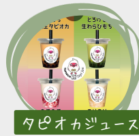
タピオカジュース