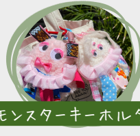
モンスターキーホルダー