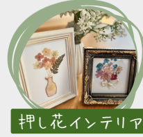
押し花インテリア