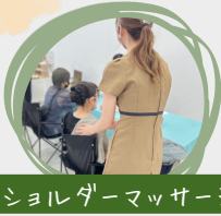
ショルダーマッサージ