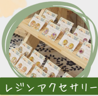
レジンアクセサリー