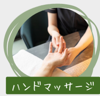
ハンドマッサージ