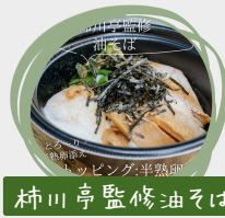
柿川亭監修油そば