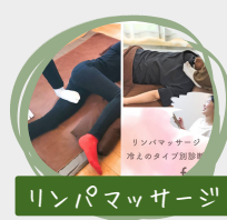
リンパマッサージ