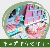
キッズアクセサリー